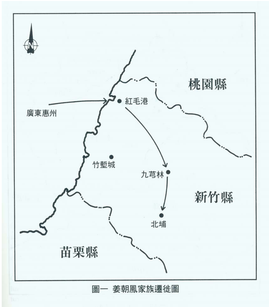
圖一 姜朝鳳家族遷徙圖