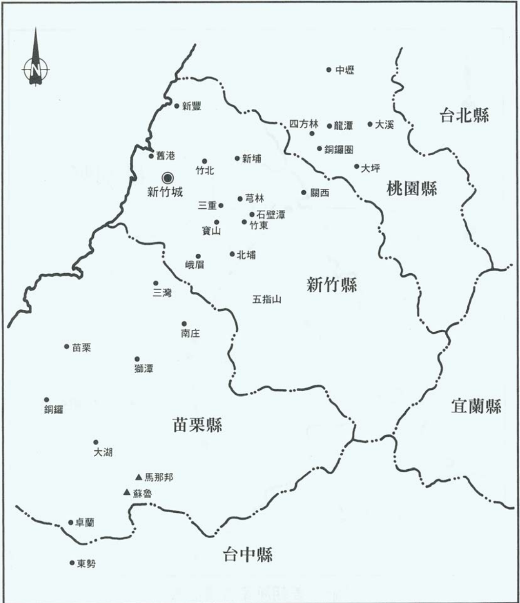
圖二 姜朝鳳家族發展關係圖